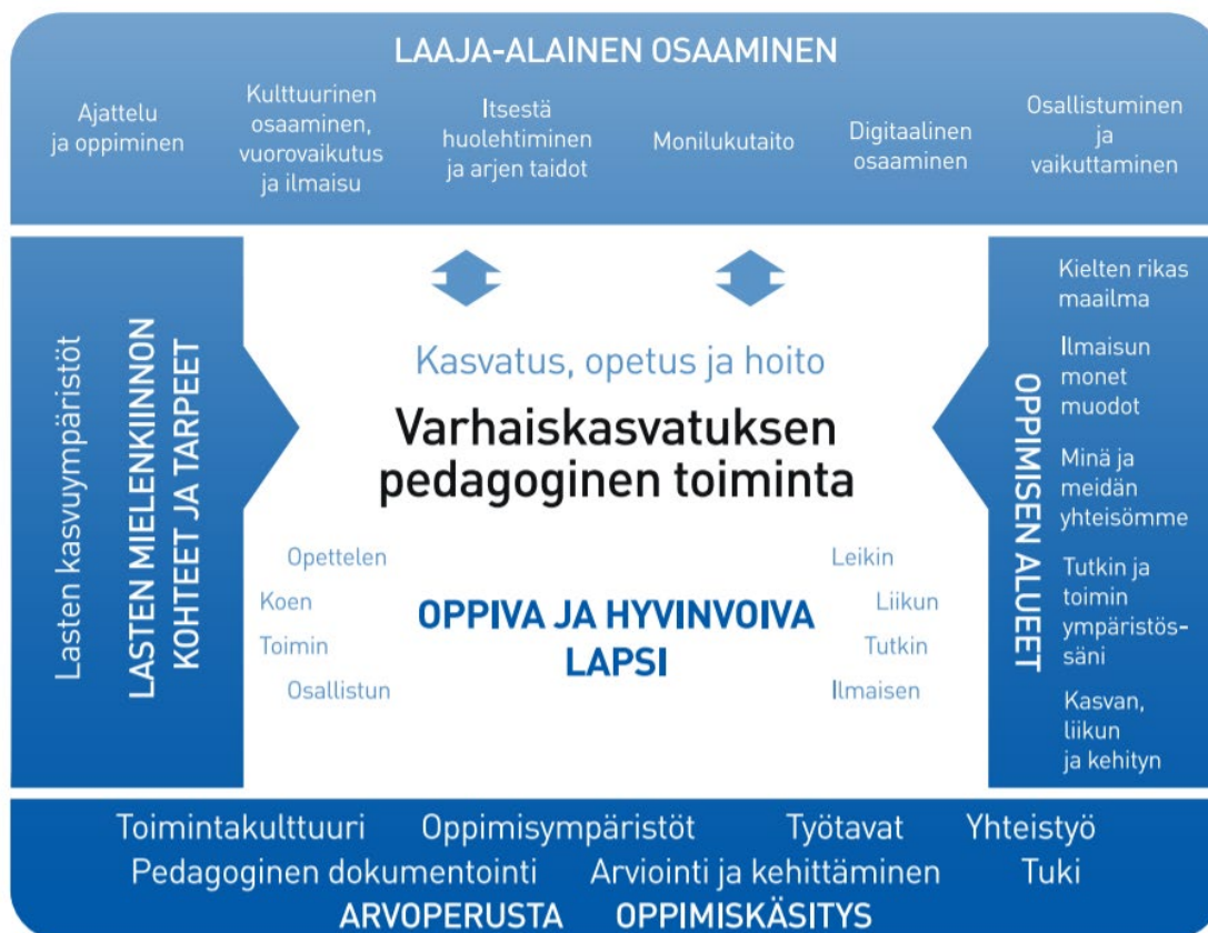
Kuvio 3. Varhaiskasvatuksen pedagogisen toiminnan viitekehys

Varhaiskasvatuksen pedagogista toimintaa ja sen toteuttamista kuvaa kokonaisvaltaisuus. Tavoitteena on edistää lasten oppimista ja hyvinvointia sekä laaja-alaista osaamista (kuvio 3). Pedagoginen toiminta toteutuu lasten ja henkilöstön välisessä vuorovaikutuksessa ja yhteisessä toiminnassa. Lasten omaehtoinen, henkilöstön ja lasten yhdessä ideoima sekä henkilöstön suunnittelema toiminta täydentävät toisiaan. Varhaiskasvatuksen pedagoginen toiminta läpäisee kasvatuksen, opetuksen ja hoidon kokonaisuuden.