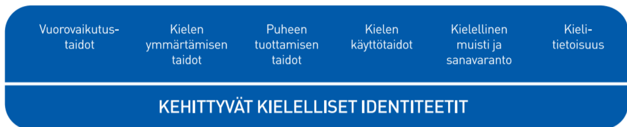
Kuvio 4. Lasten kielen kehityksen keskeiset osa-alueet varhaiskasvatuksessa

Kielen oppimisen kannalta on tärkeää tiedostaa, että saman ikäiset lapset voivat olla eri vaiheissa kielen kehityksen eri osa-alueilla. Kielelliset identiteetit kehittyvät , kun lapsia ohjataan ja tuetaan kielellisten taitojen ja valmiuksien keskeisillä osa-alueilla.