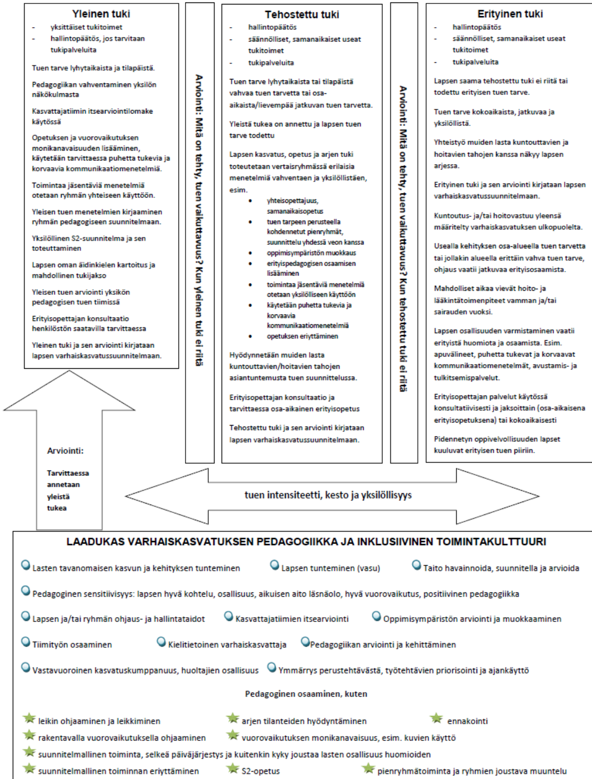
Liite 1: Tuen tasot ja niiden toteuttamisen käytännöt varhaiskasvatuksessa